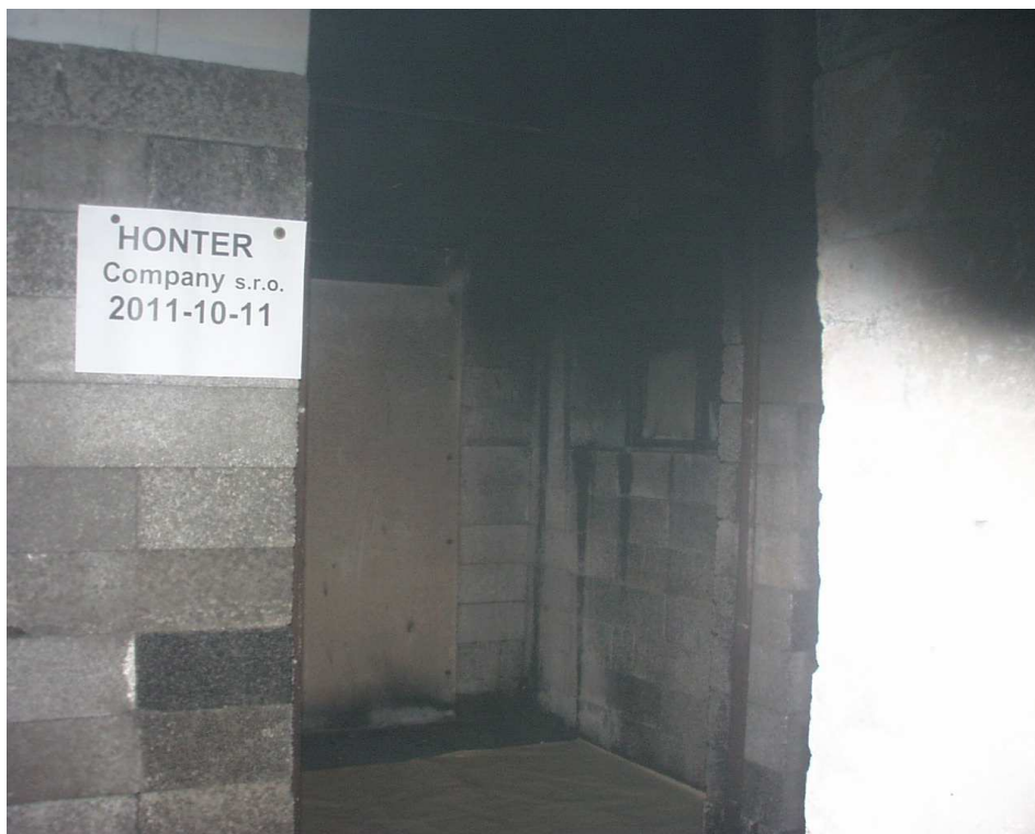
Pohled na zkušební vzorek č. 1 po zkoušce