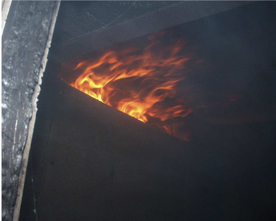
Pohled na zkušební vzorek č. 1 (8. min zkoušky)