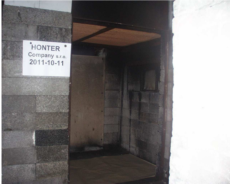
Pohled na zkušební vzorek č. 1 před zkouškou

Po instalaci zkušebního tělesa byly fotograficky zaznamenány pohledy na vzorek č. 1, prakticky identické pohledy na vzorek č. 2 nejsou uváděny: