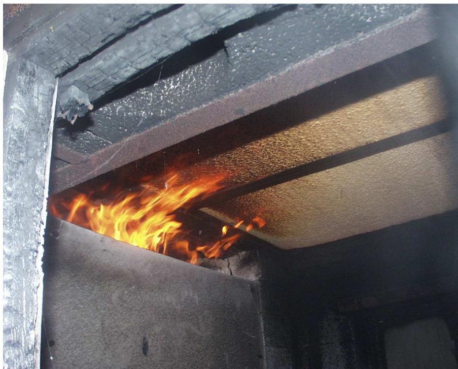
Detail zkušebního vzorku č. 1 při zkoušce (2. min zkoušky)